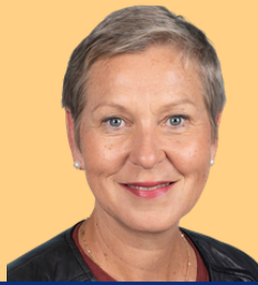
ANNE LE HÉNaNFF Ministre déléguée en charge de l'Intelligence artificielle et du Numérique